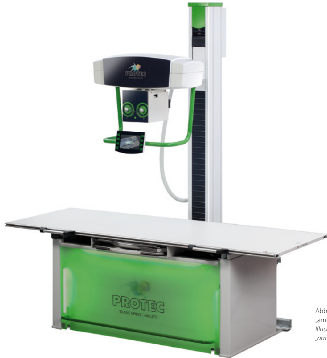
Abbildung zeigt das attraktive „ambient light“ am Tisch. Illustration shows the attractive „ambient light“ of the table.