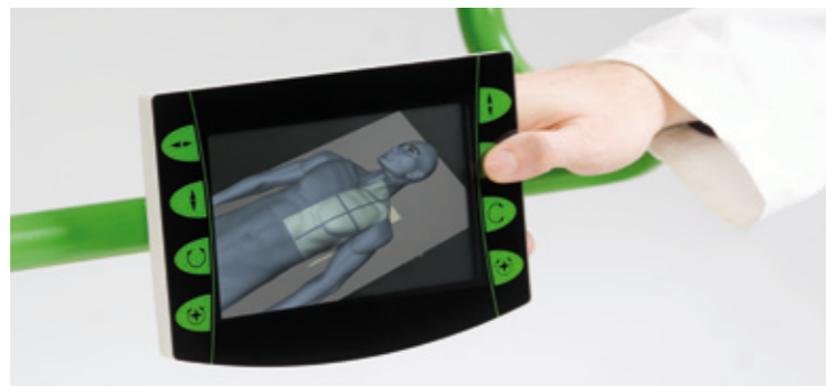
Einfachste Bedienung, optimaler Workflow. Ease of use at its best, optimum workflow.